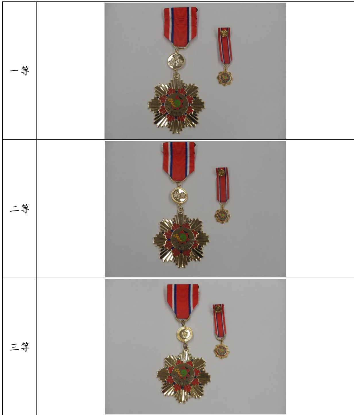
附表二 獎章式樣及圖說